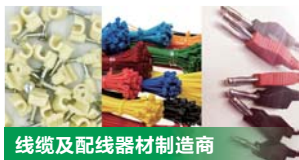
线缆及配线器材制造商