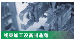
线束加工设备制造商